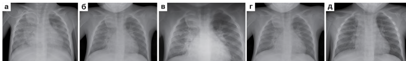
Рис. 2. Обзорная рентгенограмма ОГК: а) 24.04.2020 г. увеличение внутригрудных лимфоузлов бронхопульмональных групп с обеих сторон, инфильтративные изменения в верхней доле правого легкого, осумкованный плеврит; б) 27.05.2020 г. увеличение бронхопульмональных групп внутригрудных лимфоузлов с обеих сторон, нарастание инфильтрации в верхней доле правого легкого, осумкованный плеврит; в) 21.09.2020 г. положительная динамика, в виде уменьшения размеров внутригрудных лимфоузлов; з) 19.10.2020 г. положительная динамика в виде уменьшения выраженности инфильтративных изменений; д) 01.02.2021 г. положительная динамика в виде уменьшения лимфоаденопатии внутригрудных лимфоузлов всех групп и выраженности инфильтративных изменений в верхней доле правого легкого; восстановление пневматизации легких

Рентгенологически отмечена хорошая положительная динамика в виде уменьшения выраженности инфильтративных изменений в проекции верхней доли правого легкого, восстановления пневматизации легких. Уменьшение выраженности лимфоаденопатии ВГЛУ всех групп (рис. 2в, 2г). По данным КТ ОГК 20.11.2020 г. – по сравнению с КТ от 05.03.2020 г. – положительная динамика: частичное рассасывание изменений в легких, умень-